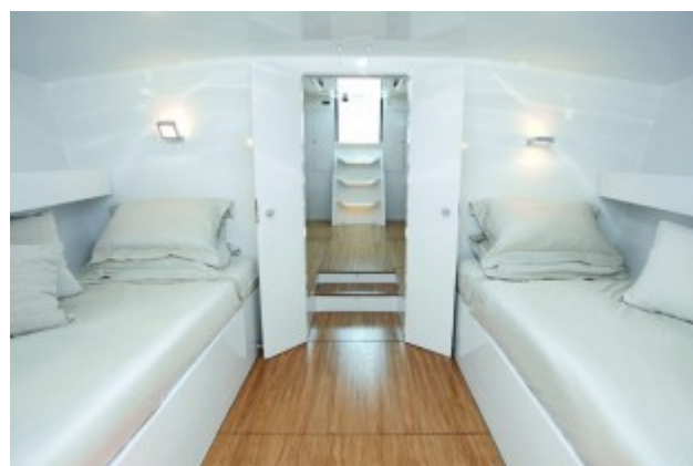
Cabinata Armatoriale a prua

Ma l'alto livello delle finiture e della qualità della vita di bordo è dichiarato anche dal resto: aria condizionata, ice-maker, coffee machine Miele. Torna a essere uguale ai fratelli di cantiere, il Natali, negli interni. Sia per i bagni, tutti dotati di un'ampio spazio isolato riservato alla doccia, ricavati nella zona poppiera dello scafo a vantaggio della vivibilità delle zone comuni sia per la costruzione rigorosamente strutturale e in sandwich di carbonio (come tutto lo scafo) di tutti gli elementi, dalle paratie agli arredi a murata. Un sistema per ridurre il peso di allestimento a vantaggio del rapporto zavorra che con i suoi 7500 chili rappresenta il 46% della stazza totale.