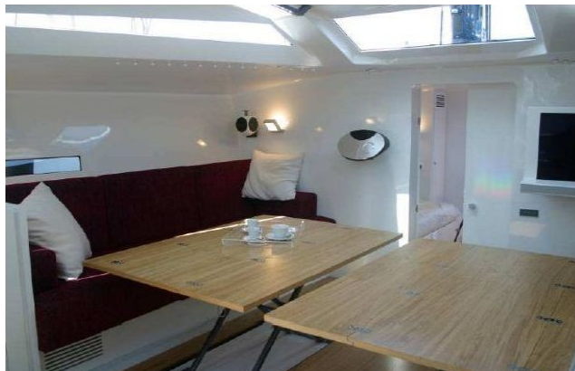
Dinette lato Sx

Il risultato è uno spazio totalmente sgombro in cui la luce non incontra ostacoli. L'idea di spazio e di ampiezza è accentuata oltre che dai colori (l'unico strappo al bianco, oltre al pagliolo dalla bionda essenza, è dato dalla tappezzeria rosso pompeiano dei due divani in quadrato) anche dalla scelta dei complementi d'arredo, come l'impianto audio video Bang & Olufsen: un'icona del design raffinato ed essenziale.