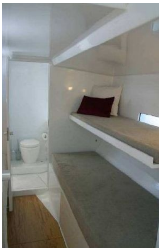
Cabinata ospiti Sx (si notano solo due dei tre letti)

Il risultato è uno spazio totalmente sgombro in cui la luce non incontra ostacoli. L'idea di spazio e di ampiezza è accentuata oltre che dai colori (l'unico strappo al bianco, oltre al pagliolo dalla bionda essenza, è dato dalla tappezzeria rosso pompeiano dei due divani in quadrato) anche dalla scelta dei complementi d'arredo, come l'impianto audio video Bang & Olufsen: un'icona del design raffinato ed essenziale.