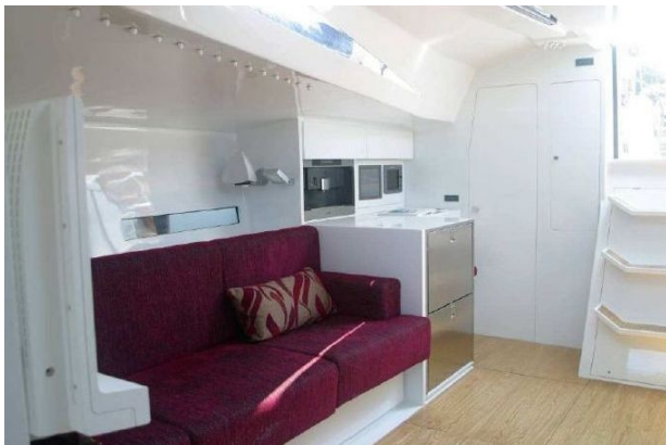
Dinette lato Dx

Natali è un condesato di Ricerca, Tecnologia, Design che non si esaurisce all'esterno ma che al contrario viene esaltato quando si scende sotto coperta dove Alessandro Vismara ha cercato di rendere lo spazio il più aperto e luminoso possibile. Oltre alla grande finestratura della tuga che dà luce e visibilità, la tipologia degli arredi ha aiutato molto a raggiungere lo scopo. Per la dinette, infatti, non è stato scelto un tavolo fisso, ma una soluzione inedita nei progetti Vismara di questa taglia. Un doppio tavolo che, quando non è utilizzato, scompare nel pagliolo grazie a un pantografo.